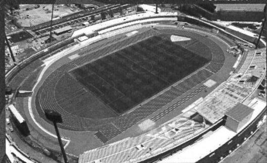
SAGA 2024 国スポ 主会場