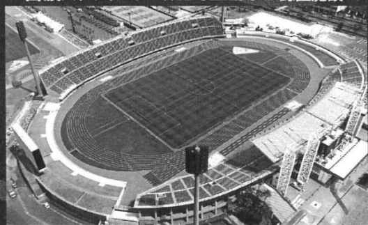
2023年 鹿児島県 特別国体 主会場