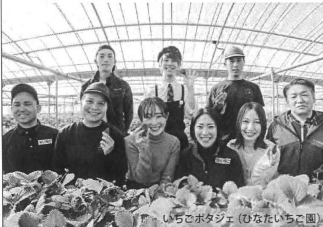
いちごポタジェ (ひなたいちご園)