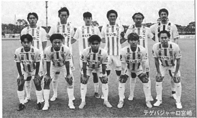
テゲバジャーロ宮崎